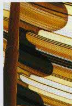
QUE LA FÊTE GOURMET SE SOUS LES TENTES BERBÈRES (EN HAUT), ET, CI-DESSOUS, MÉRICATO, MARQUÈSE ET NAVIGLIANO !