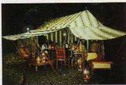
彼のテントはほとんどが大きくて、フ ッチな人たちのガール・パーティー用 に作られる。