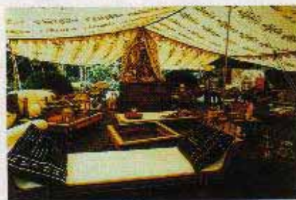
古き良き日のハイ・ソサエティのピク ニック気分を盛り上げる。