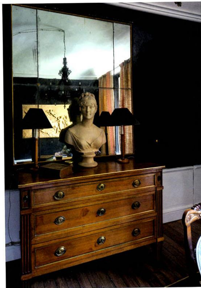
A SINISTRA: UNA PICCOLA BREAKFAST ROOM CHE SI AFFACCIA SUL CORRIDORO, LE PARETI SONO DIPINTE DI SMALTO NERO. SOPRA: UN CASSETTONE LUGI XVI CON APPOGGIATO UN BUSTO LEFT: A SMALL BREAKFAST ROOM OVERLOOKING THE CORRIDOR, THE WALLS ARE PAINTED IN BLACK GLAZE. ABOVE, A LOUIS XVI CHEST SUPPORTING A BUST

esigenze" racconta l'architetto a Ville&Casali . La residenza occupa i primi due piani dell'edificio, su 200 metri quadri totali (100 a livello) e ha un giardino sul quale affacciano molte delle stanze. E dire che l'acquisto era nato come un investi-