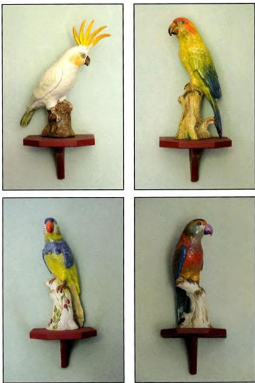
IN APERTURA , IL LIVING CON VISTA SUL GIARDINO. SOPRA , UNA COLLEZIONE DI PAPPAGALLI DI MEISSEN E ALTRI DI PORCELLANA 1870- 1890. A DESTRA , UNA CONSOLLE DI MARMO LUIGI XVI, SULLA PARETE QUATTRO MASCHERE NEOCLASSICHE, E SULLO SFONDO, IL CORRIDOIO.